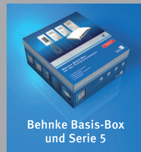
Behnke Basis-Box und Serie 5