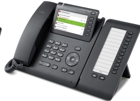
OpenScape Desk Phone CP600/CP600E