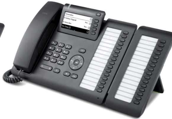
OpenScape Desk Phone CP400