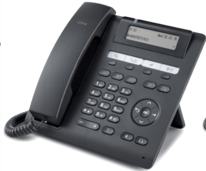
OpenScape Desk Phone CP200/CP205