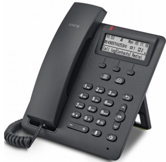
OpenScape Desk Phone CP100