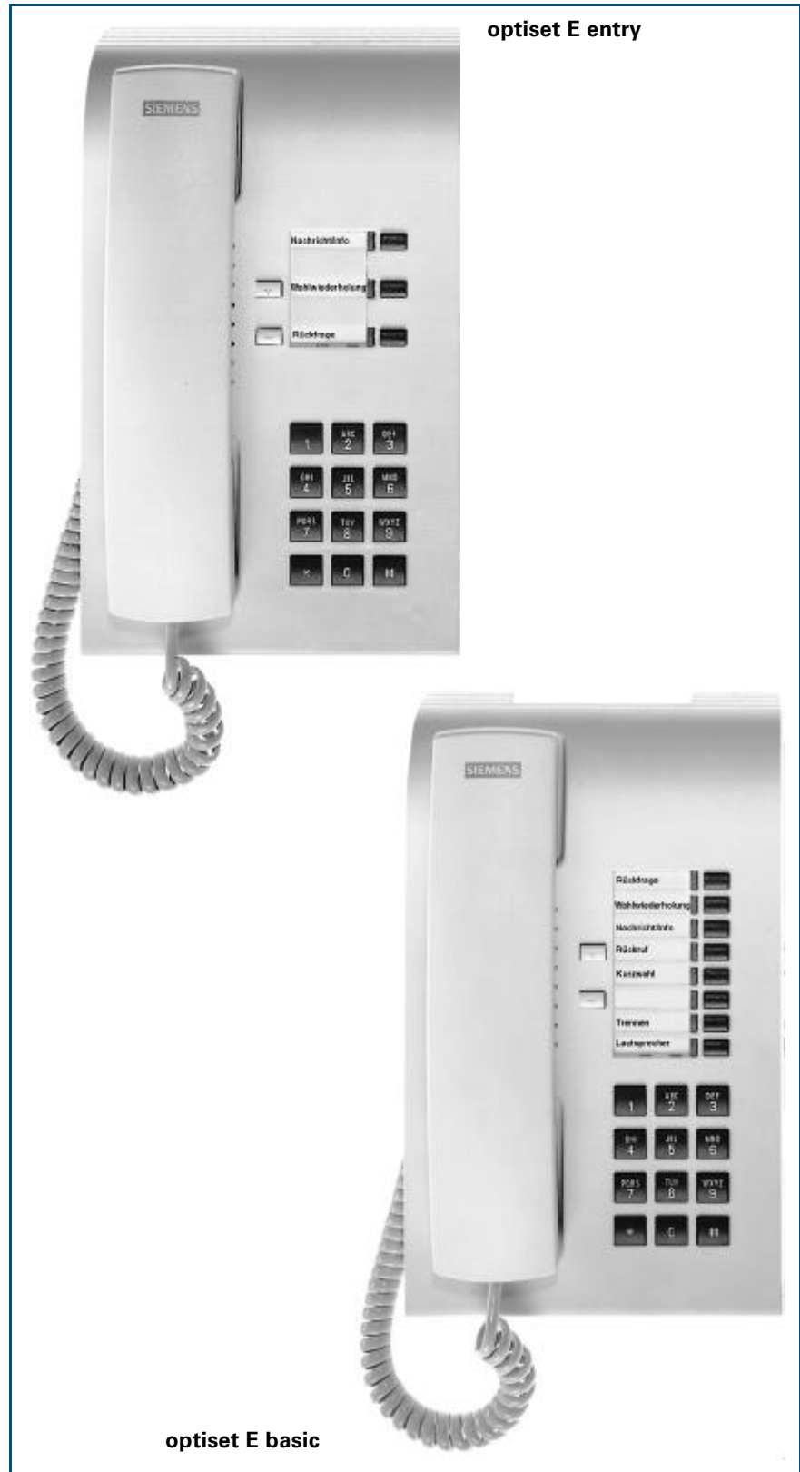
optiset E basic