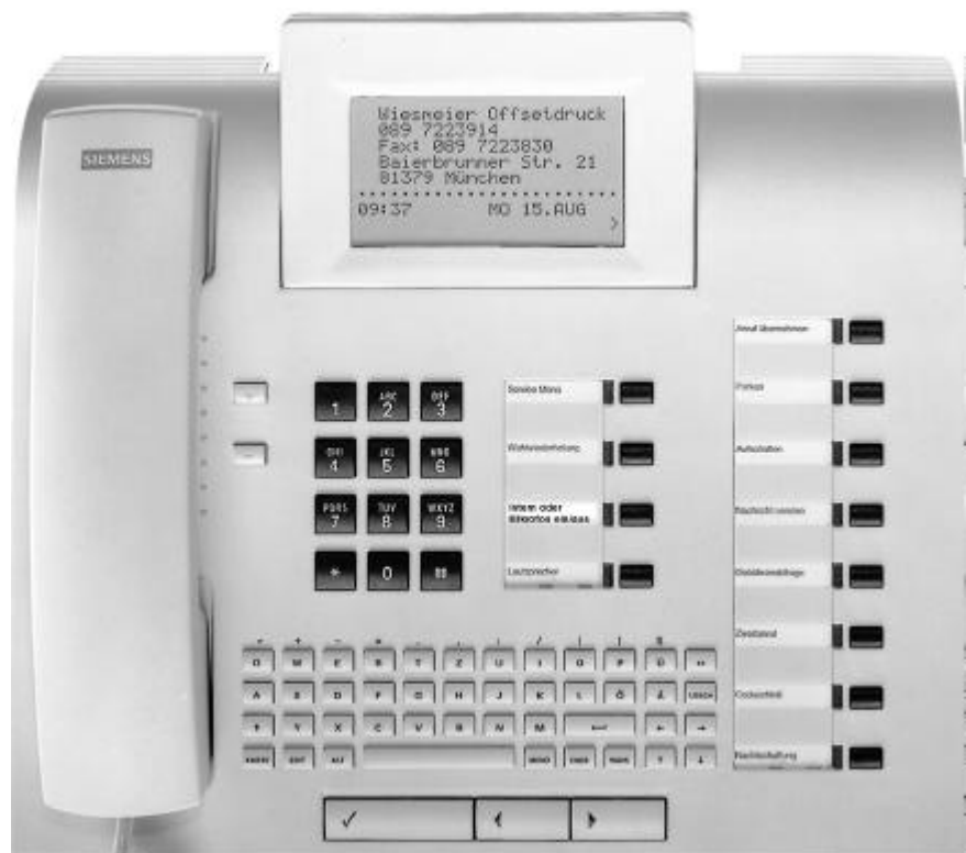
optiset E memory