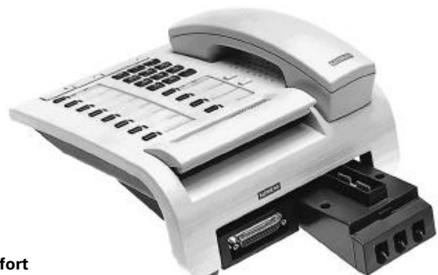
optiset E comfort